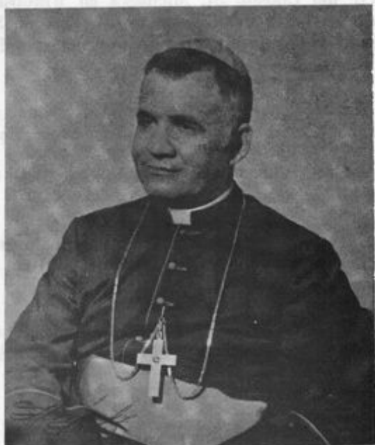
Su Excelencia Monseñor Ulises Casiano Obispo Diócesis de Mayagüez