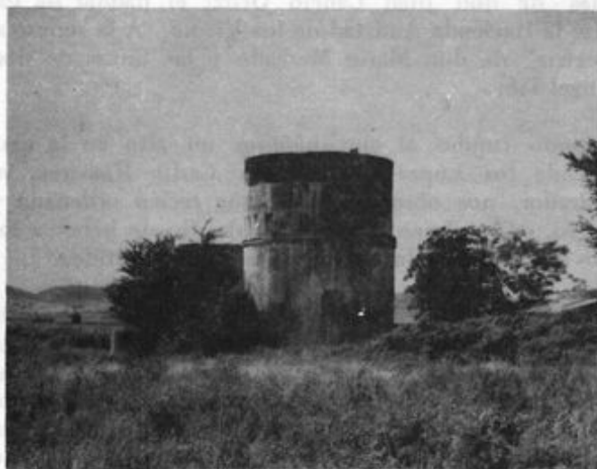
Fig. 51 La vieja "cambija" del ferrocarril en la Estación Campo.