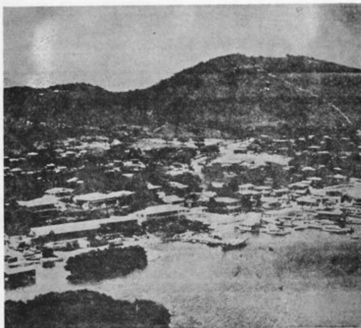
Fig. 53 Vista aérea parcial de La Parguera, Lajas. Sitio de verano en la parte sur de Puerto Rico.